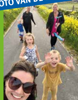
FOTO VAN DE WEEK