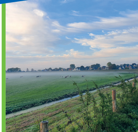
Ilpendam tijdens zonsopkomst. De koeien voorop en daarachter het dorp in ochtendmist gehuld. Een prachtige foto die we van Lia Vermeulen gemild kregen.

Ook met uw foto in de krant komen? Stuur uw foto dan naar communicatie@waterland.nl of tag de gemeente Waterland op social media: @gemwaterland .