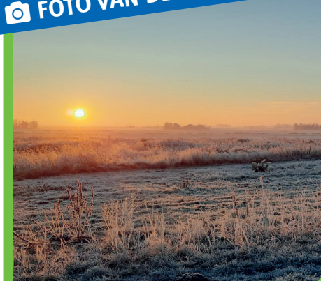
FOTO VAN DE WEEK