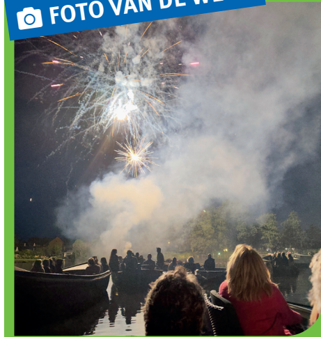
FOTO VAN DE WEEK

Het grote traditionele vuurwerk tijdens de feestweek in Broek in Waterland. Het Havenrak lag weer vol met bootjes en toeschouwers.