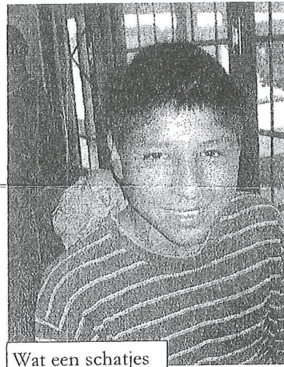
Wat een schatjes