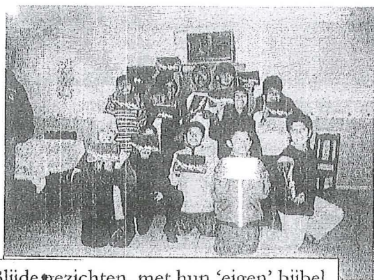
Blijde gezichten, met hun 'eigen' bijbel