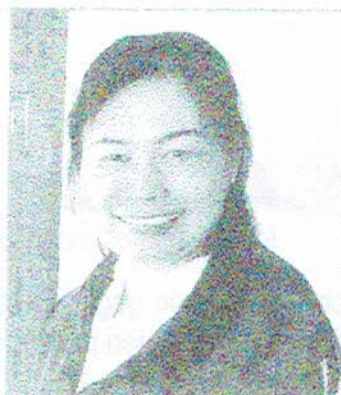
Afscheid Phi Deuan

werk zoeken en proberen op zichzelf te gaan wonen. Twee meisjes van 18 jaar zijn net geslaagd voor hun HAVO-VWO. Deze zomervakantie willen ze graag gaan werken en daarna zullen ze beiden verder gaan studeren. De één wil verpleegkundige worden en de ander wil logistiek gaan studeren. Beide meisjes zullen doordeweeks bij de universiteit gaan wonen en in de weekenden en/of vakanties thuis komen in de zelfstandig-wonen huisjes op het terrein. Er zullen deze maand twee zusjes van 5 en 6 jaar binnenkomen. Twee meisjes van 18 en 20 jaar hebben werk gevonden voor de zomervakantie en zijn super trots en blij dat ze geld gaan verdienen, waardoor ze bijvoorbeeld een telefoon kunnen kopen. De maand maart staat in het teken van huisbezoeken voor de meisjes die familie hebben als het veilig is om er