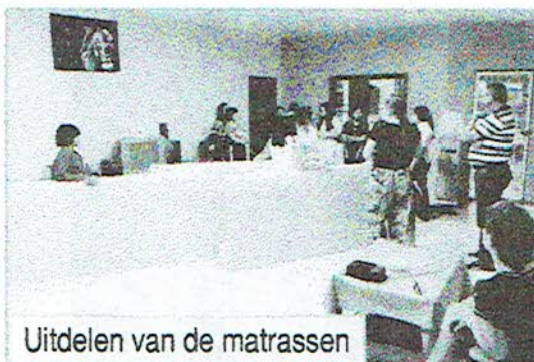
Uitdelen van de matrassen