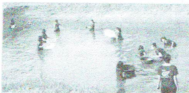
De visvijver leeghalen vanwege watertekort

De één wil verpleegkundige worden en de ander wil logistiek gaan studeren. Beide meisjes zullen doordeweeks bij de universiteit gaan wonen en in de weekenden en/of vakanties thuis komen in de zelfstandig-wonen huisjes op het terrein. Er zullen deze maand twee zusjes van 5 en 6 jaar binnenkomen. Twee meisjes van 18 en 20 jaar hebben werk gevonden voor de zomervakantie en zijn super trots en blij dat ze geld gaan verdienen, waardoor ze bijvoorbeeld een telefoon kunnen kopen. De maand maart staat in het teken van huisbezoeken voor de meisjes die familie hebben als het veilig is om er