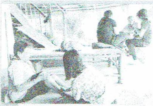
Meisje bezoekt adoptiemoeder