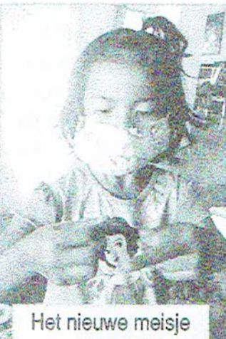
Het nieuwe meisje

zusje van 6 uit huis geplaatst moest worden wegens verwaarlozing, mishandeling door drankmisbruik van haar vader en het gevaar wat zij loopt om ook misbruikt te worden. Zij werd doorverwezen naar een ander kindertehuis in Chiang Rai omdat zij nog niet seksueel misbruikt was en dus niet naar ons kon, althans dat namen zij aan. Toen wij het er als collega's over hadden vroeg ik of wij haar niet op konden nemen zodat ze bij haar zus kan wonen. Hier waren zij het mee eens. Na overleg met de juiste partijen is dat precies wat er gebeurd is. Wij gingen van huis met één meisje en kwamen met twee meisjes terug. Het mooie van dit horrorverhaal is dat de twee zusjes herenigd zijn en in de Schuilplaats samen op mogen groeien. De eerste dagen was het zusje vreselijk stil en terug-