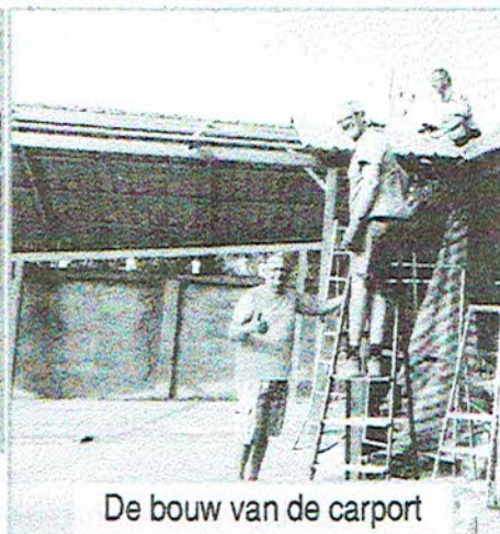
De bouw van de carport