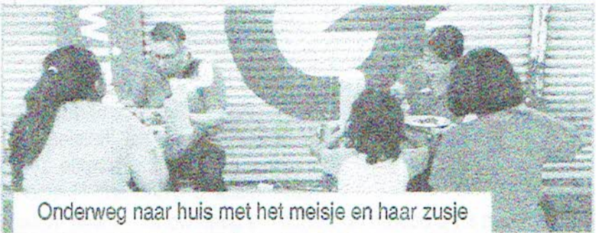
Onderweg naar huis met het meisje en haar zusje

chauffeurs mee gegaan naar een politieonderzoek in een provincie 4 uur van huis. Het meisje van 13 jaar moest mee om haar verhaal te doen en de verschillende plaatsen van delict te laten zien. Zij is door drie verschillende mannen misbruikt en haar vader heeft haar niet kunnen beschermen door zijn levensstijl. Op het politiebureau was ook een maatschappelijk werkster van het regeringskinder tehuis aanwezig, die het meisje naar ons doorverwezen hebben. In het gesprek wat zij hadden bleek dat ook het jongere