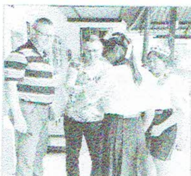
Wij zijn geslaagd!

in de Schuilplaats om voor haar zieke vader en oom te gaan zorgen. Ook haar eigen man is niet fit en heeft hulp nodig in het werk wat hij als pastor doet. Toen wij in de zomer van 2006 voor het eerst met ons gezin in Thailand kwamen om kennis te maken was zij één van de vier nieuwe stafleden die in het derde huis kwamen werken. Dit huis was toen net geopend en er waren nog geen meisjes. We kennen elkaar al zo lang en hebben elkaars zoons zien opgroeien en samen gewerkt. Het oudste meisje is nu 22 jaar en heeft net haar stagejaar afgerond. Zij heeft dat in Bangkok gedaan. Zij is nu terug en woont in de zelfstandig-wonen huisjes op het terrein waar ze haar laatste scriptie afmaakte en inleverde. Zij is geslaagd voor haar opleiding 'Food and Nutrition Technology' aan de universiteit. Zij gaat