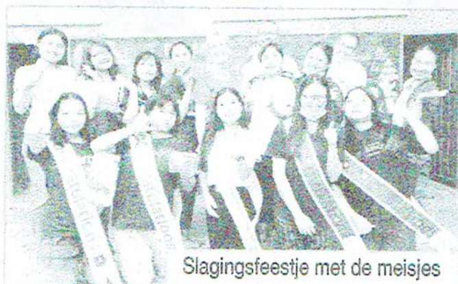
Slagingsfeestje met de meisjes

onze neuzen op de feiten worden gedrukt en dan vloeien de tranen rijkelijk. Het besef wat onze staf voor de meisjes doet, wat zij allemaal te horen en te zien krijgen en hoe ze er voor de meisjes zijn in al die momenten geeft een diep respect voor onze collega's.*