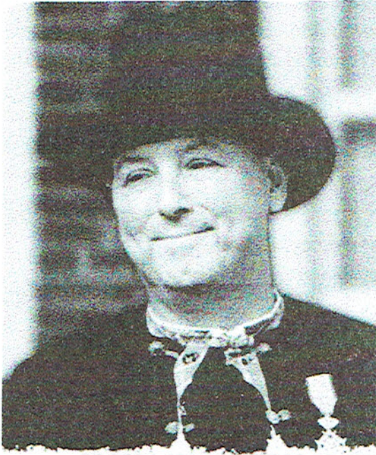
Cornelis Pieter de Waart