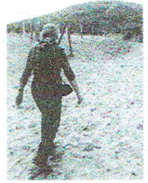
Noem mij bij mijn diepste naam Voor wie ik te lief wil ik nieten

Om mens voor een mens te zijn, wordt alleman geboren. (Huub Oosterhuis)