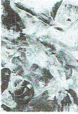
INA VISSER - KUIPERS